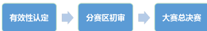
图 1.1 大赛作品评审流程

中国石油工程设计大赛作品评审工作程序主要分为三个阶段：作品的有效性认定、分赛区初审和大赛总决赛。