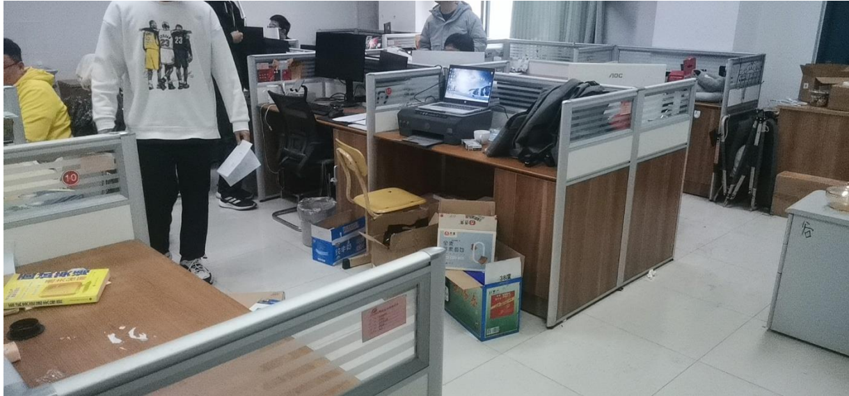
B302 油气井工程研究所