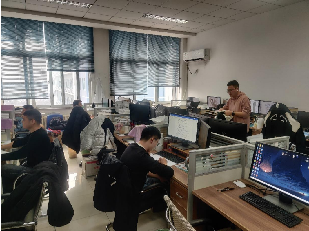
特B507 油气田化学研究所