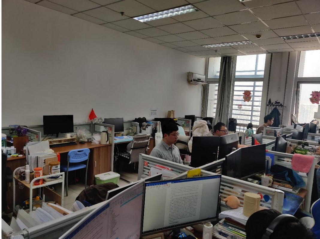
E2020 油气井工程研究所