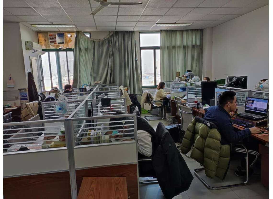
B703 油气藏工程研究所