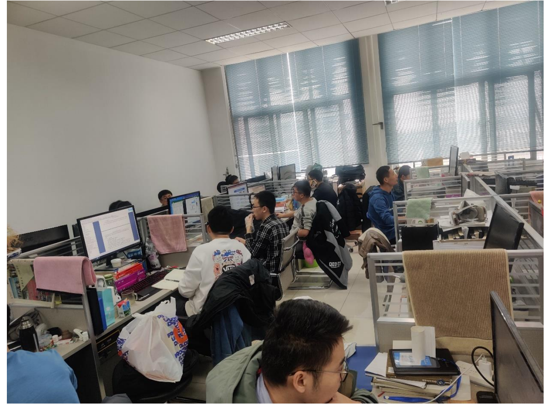
特B401 油气田化学研究所