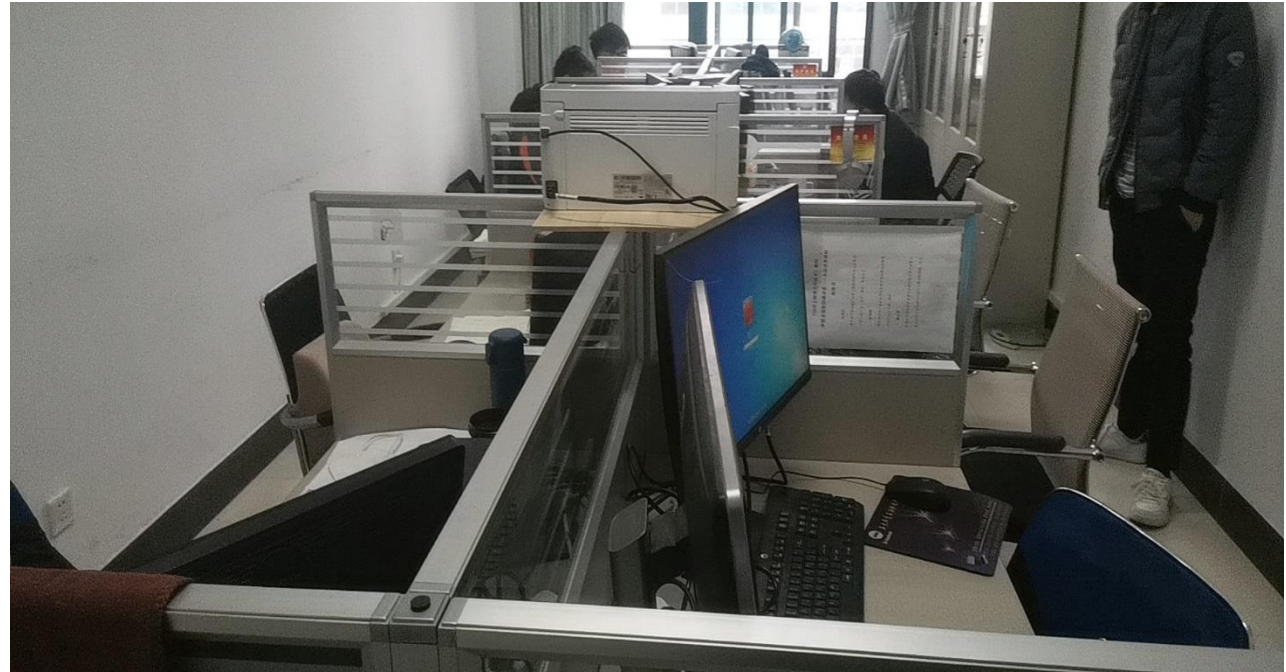
B335 油气井工程研究所