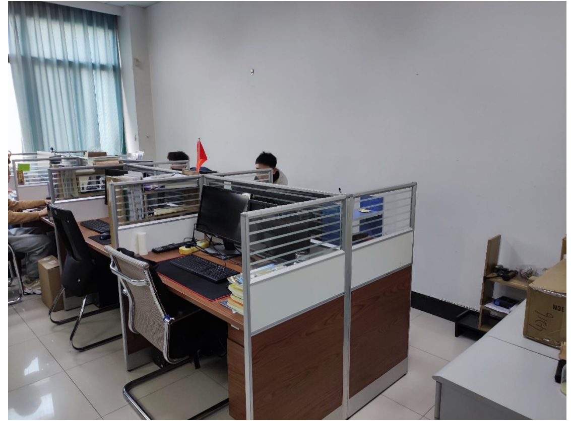
B607 油气藏工程研究所