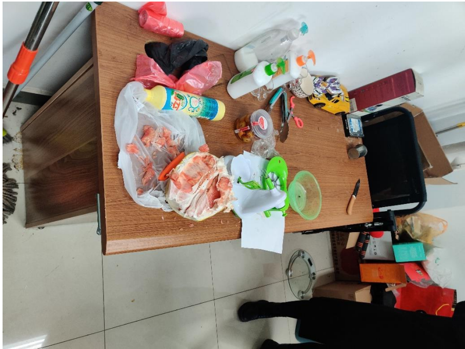
E1916 油气藏工程研究所