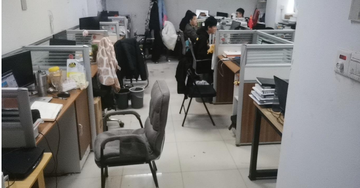
B502 油气田化学研究所