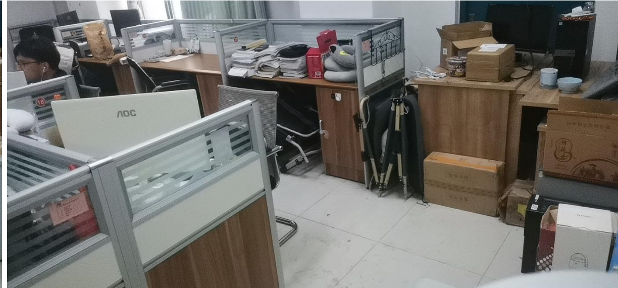
B302 油气井工程研究所