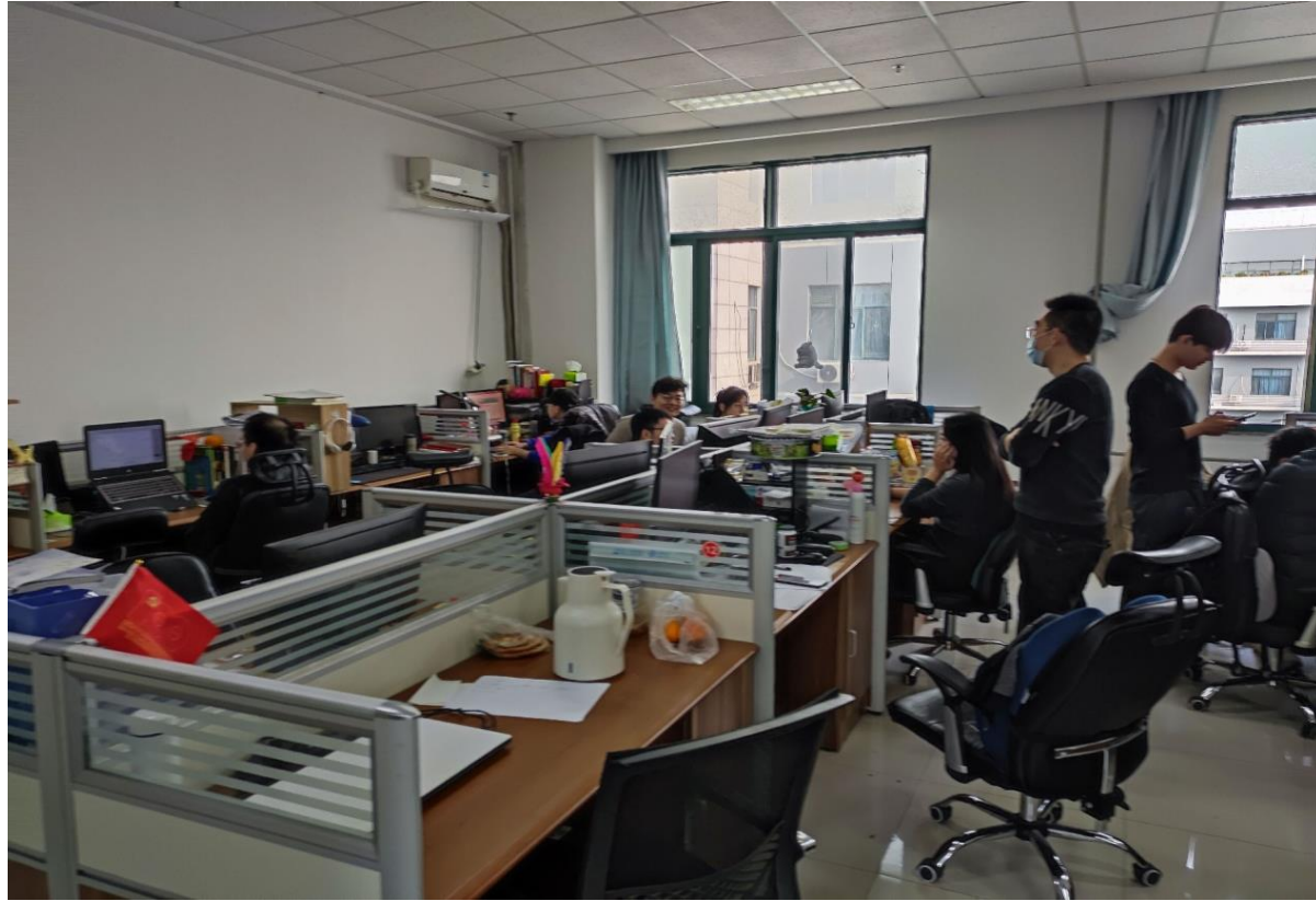
B623 油气藏工程研究所