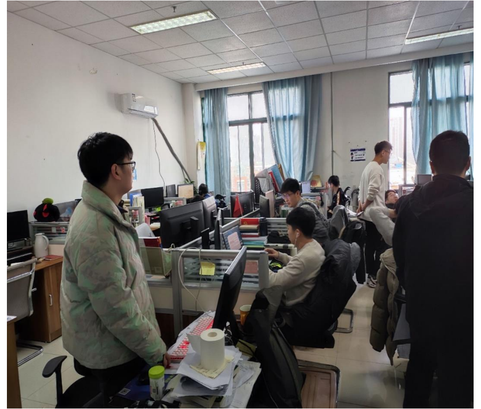
B617 油气藏工程研究所