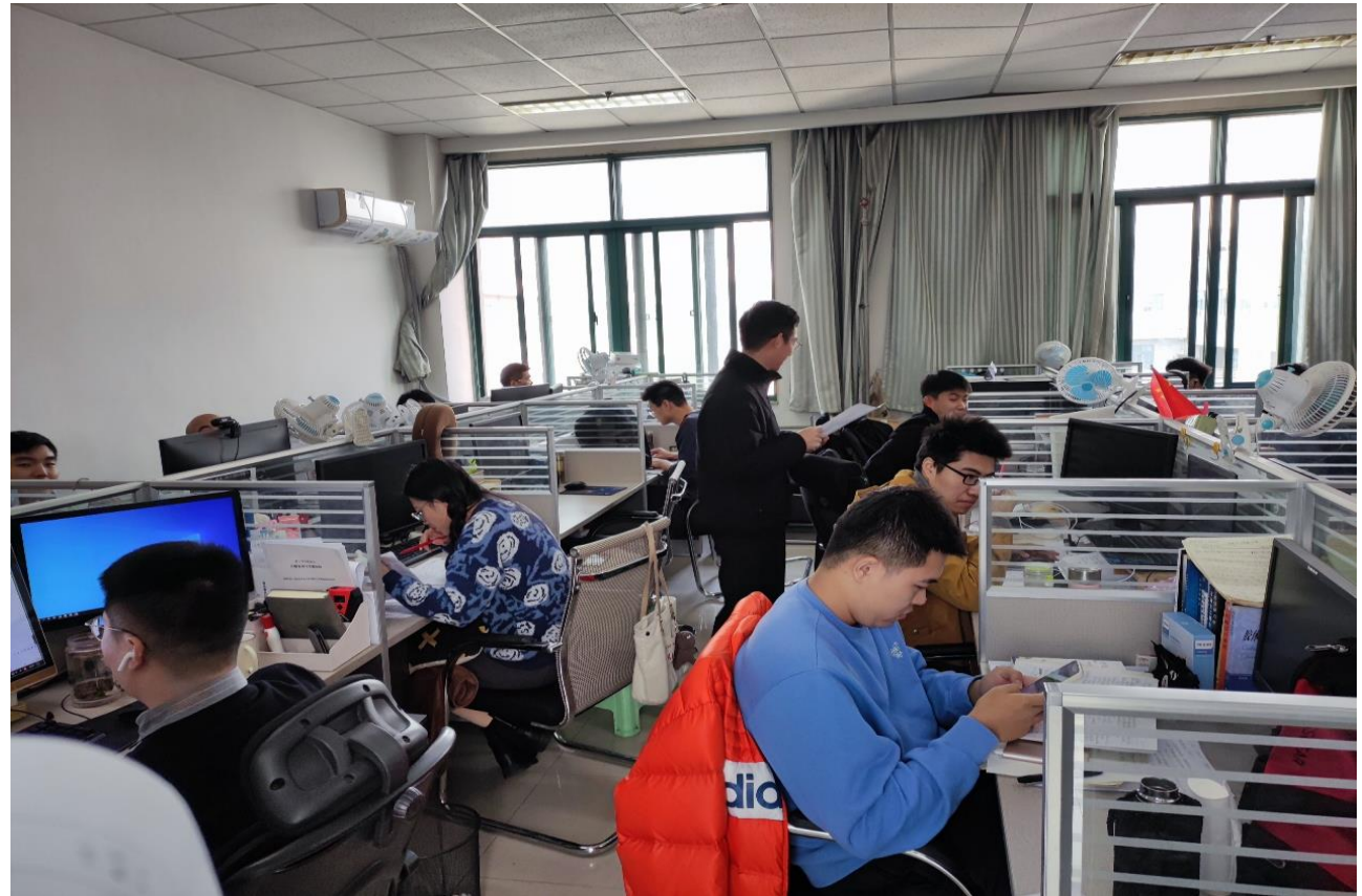
B727 油气井工程研究所