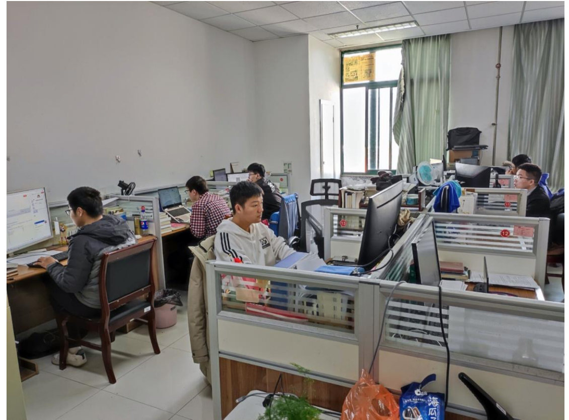
B707 海洋油气与水合物研究所