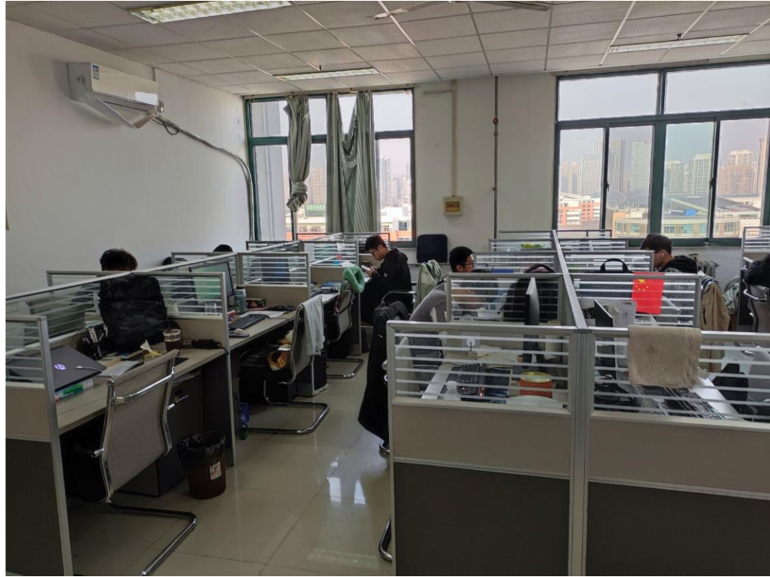
B701 船舶与海洋工程系（所）