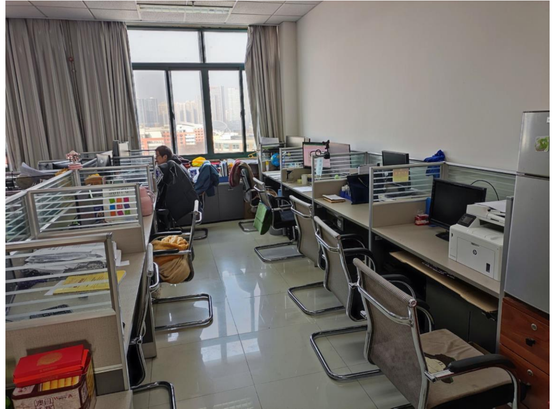
B701 船舶与海洋工程系（所）