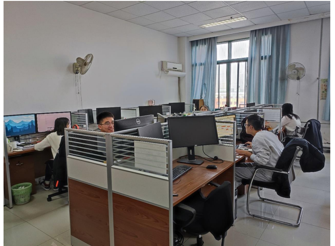
B603 油气藏工程研究所